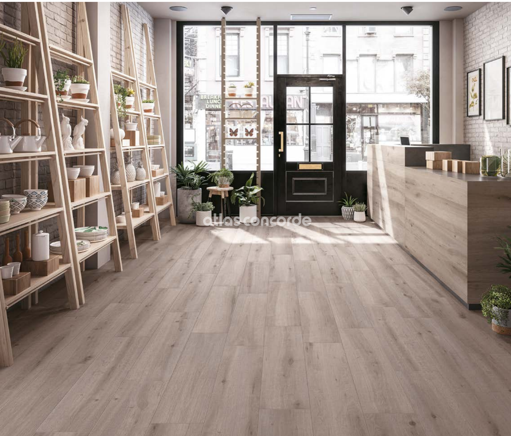
Porcelain Tiles: BREATH Grey 22,5x90 rectified - 8 7/8 "x35 5/8 "