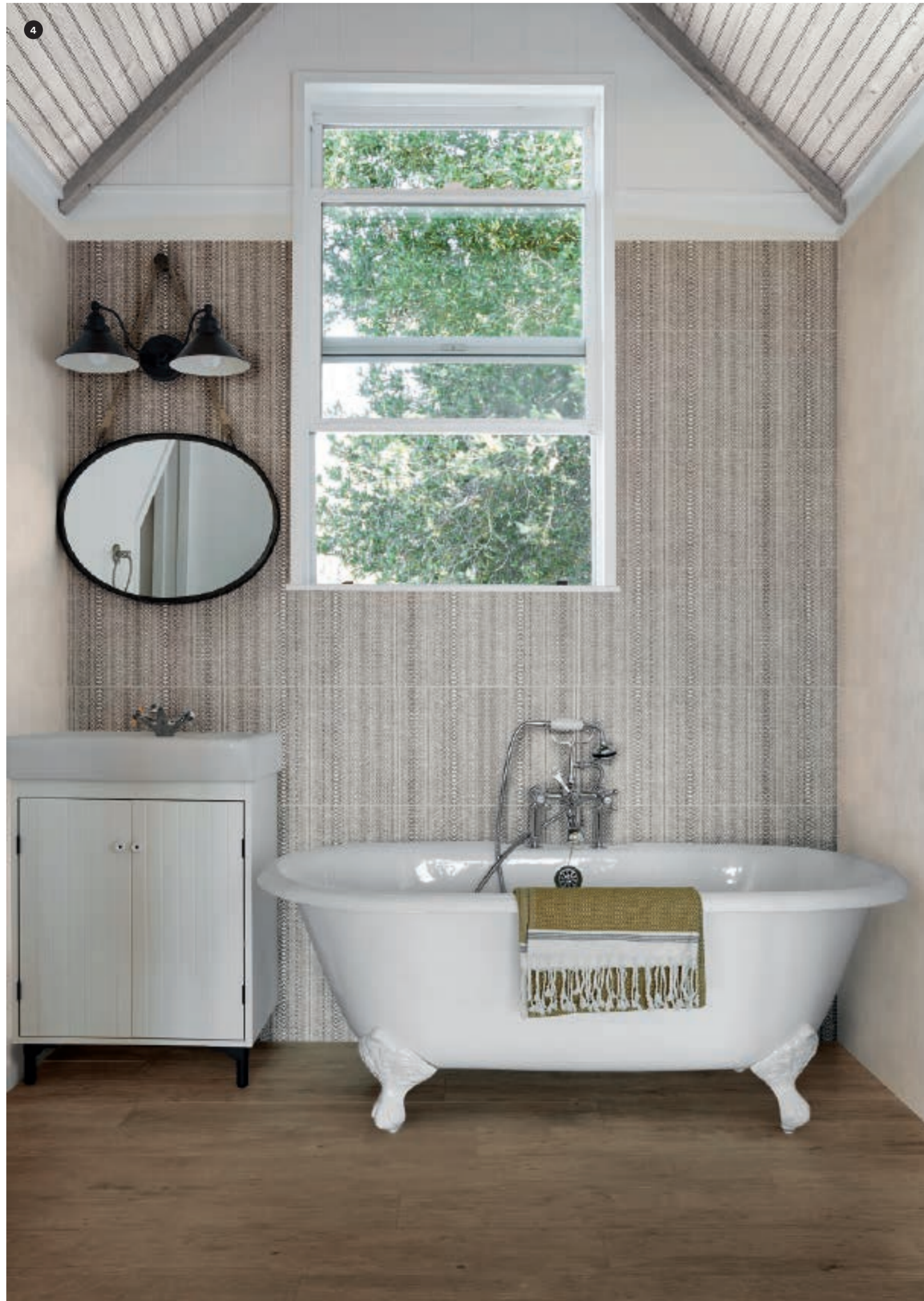
4 MQUT Fabric Cotton 40x120 MEIM Decoro Canvas 40x120 MZUD Treverkdear Brown Rett. 25x150