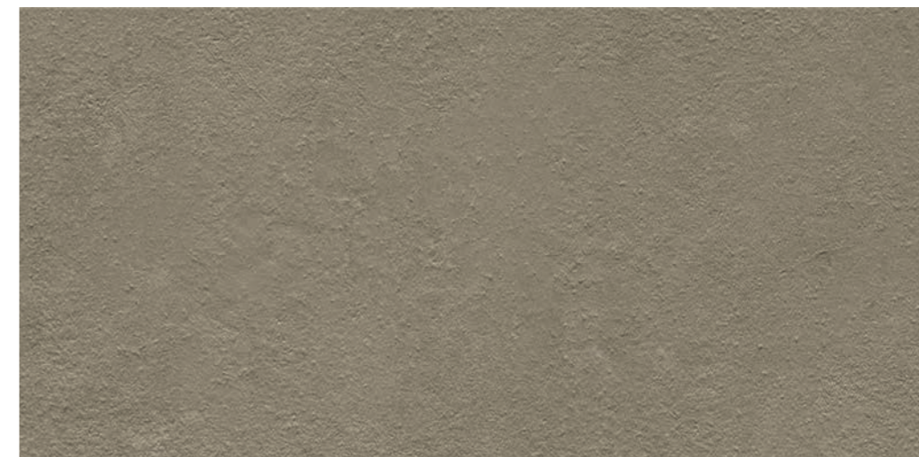
R7DT Lunar XT20 Beige rettificato 50x100