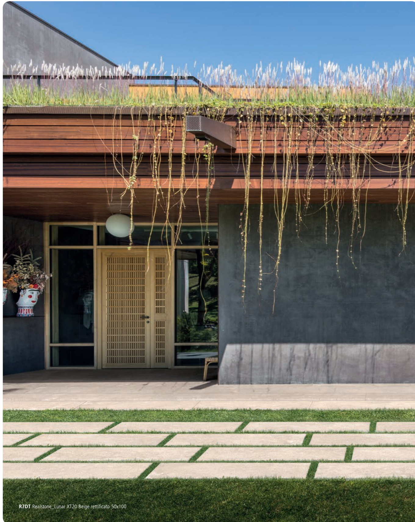
R7DT Realstone_Lunar XT20 Beige rettificato 50x100