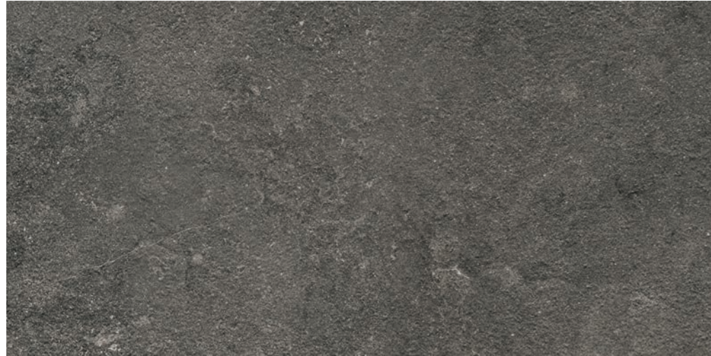
R7DV Lunar XT20 Deep Grey rettificato 50x100