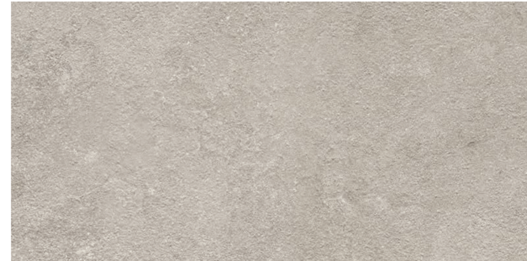
R7DS Lunar XT20 White rettificato 50x100