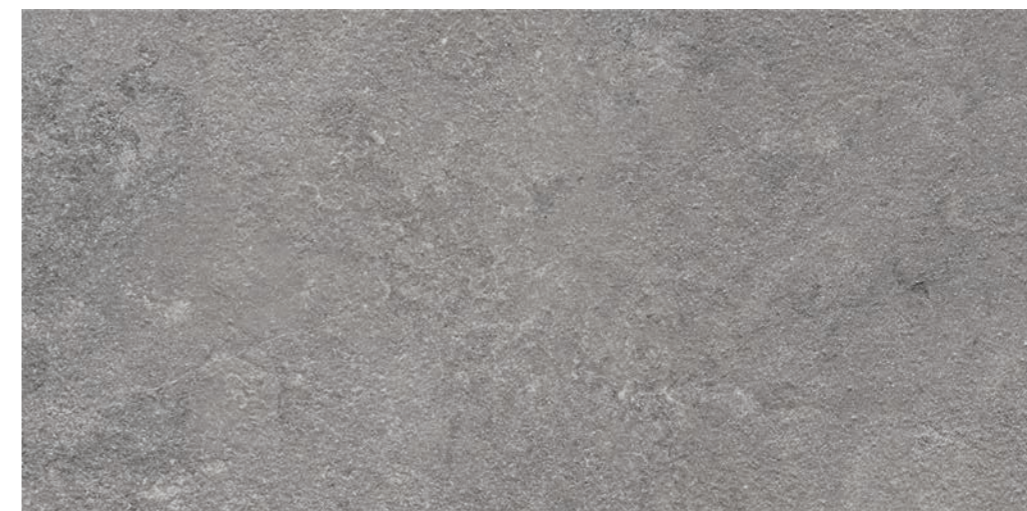
R7DU Lunar XT20 Silver rettificato 50x100