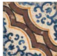
Casino di Monsignore