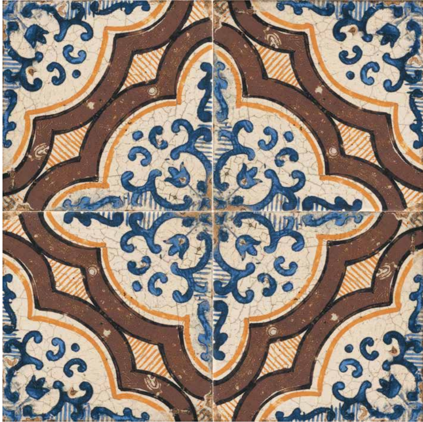
Casino di Monsignore